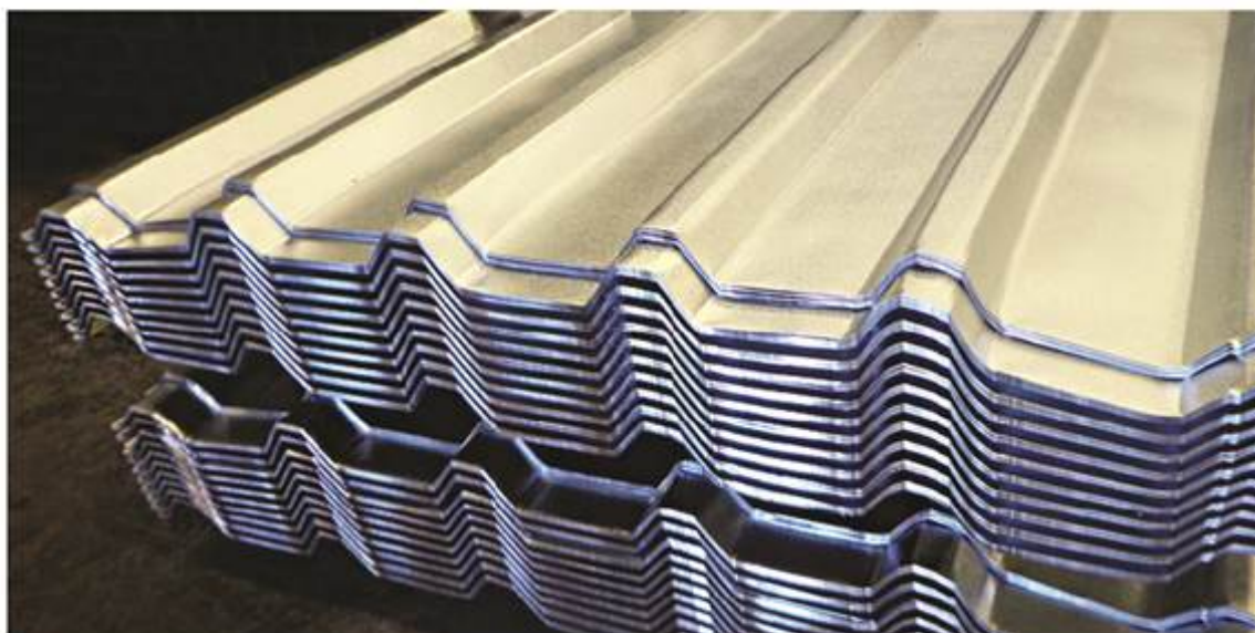
Lámina acanalada rectangular